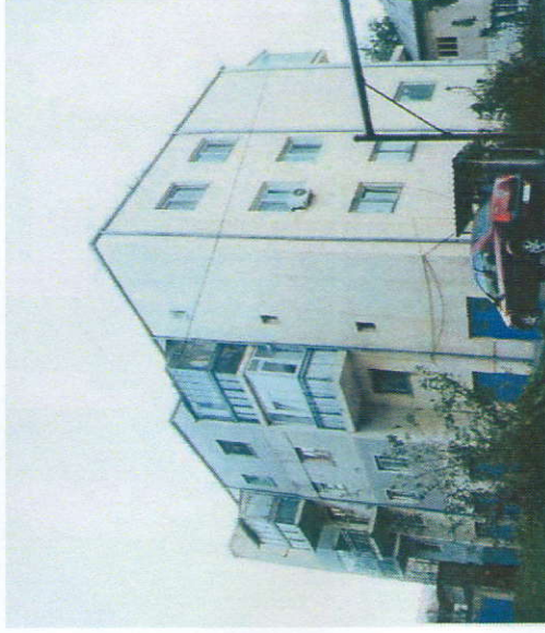
Înainte de reabilitare